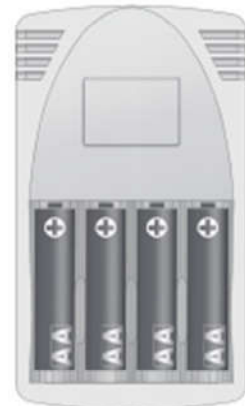
4x Mignon AA