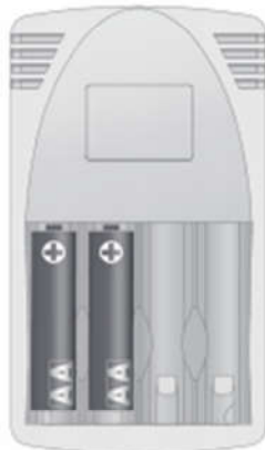
2x Mignon AA