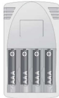
4x Micro AAA